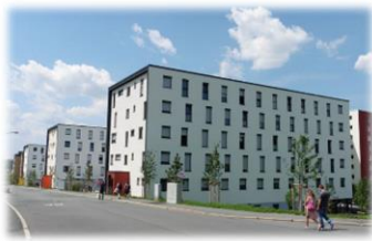
Wohnheime der Hochschule